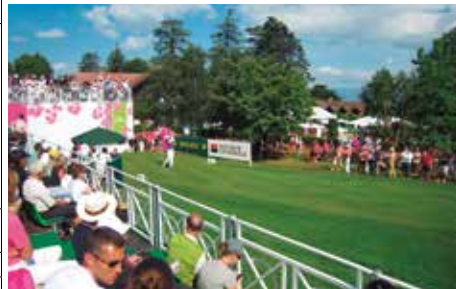
エビアン・マスターズゴルフクラブ(エビアン)