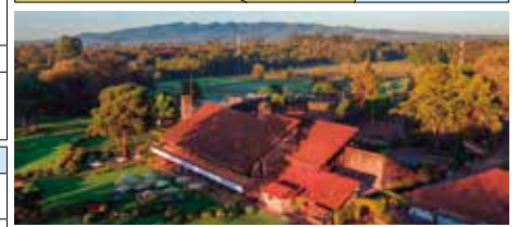
カレンカントリークラブ

ナイロビ&サファリ地域の気候 ナイロビは標高1700mの高原都市で8月の平均最高気温は23度C前後、最低気温は16度C前後、乾季で降雨量も少なく快適な気候です。アンボセリ、マサイマラもほぼ同様の気候です。