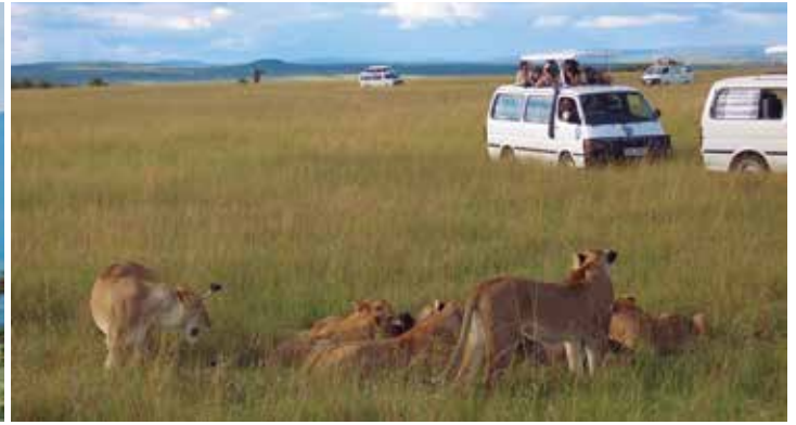
ビッグ・ファイブ(ライオン、豹、サイ、バッファロー、象)を追ってサファリ(マサイマラ国立保護区)