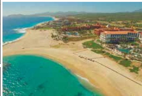
ヒルトン・ロスカボス・ビーチ&ゴルフリゾート