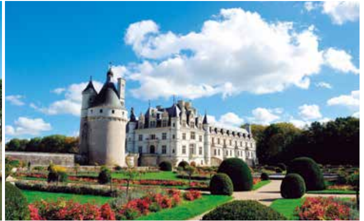
シュノンソー城(ロワール地方)