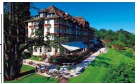
各地とも素敵ホテルに滞在(ホテル・エルミタージュ)