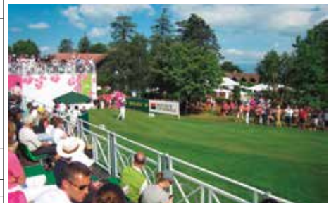
エビアン・マスターズゴルフクラブ(エビアン)