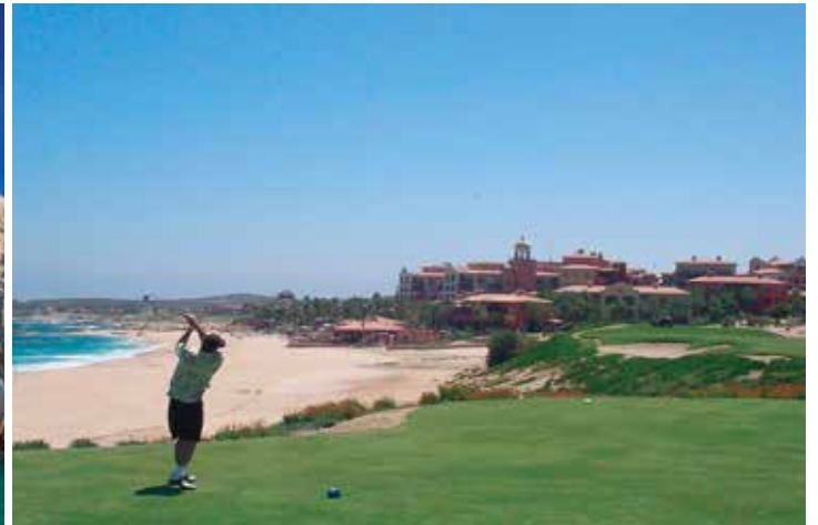
パハ・カリフォルニア半島南端のビーチ&ゴルフリゾート・ロスカボス(左)・カボ・レアルゴルフクラブとヒルトン・ロスカボス(右)