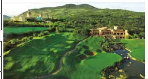
ゲイリープレイヤーカントリークラブ(サンシティ)