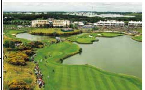
2018年ライダーカップ開催・ゴルフナショナル・アルバトロスコース