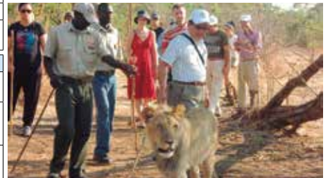
ライオンと朝の散歩(ビクトリアフォールズ)

※ゴルフプレイの順序・実施日は変更されることがありますメンテナンススケジュール等の事由によりプレイゴルフ場は変更されることがあります。