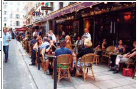
初夏のパリ・街角のカフェ