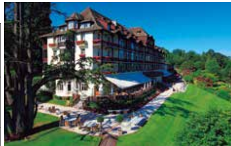
各地とも素敵なホテルに滞在(ホテル・エルミタージュ)