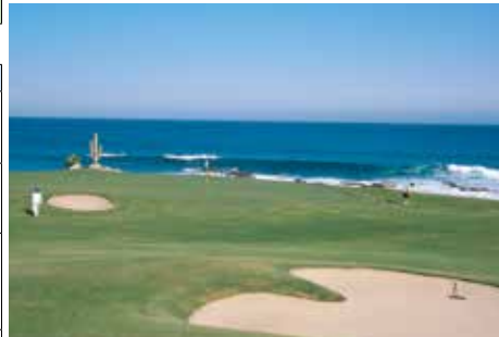
カボ・デル・ソル・オーシャンコース