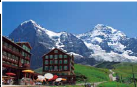
クライネシャイデック駅からのアイガー北壁とメンヒの眺め