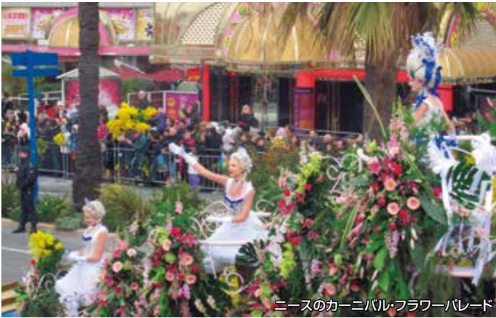
ニースのカーニバル・フラワーパレード