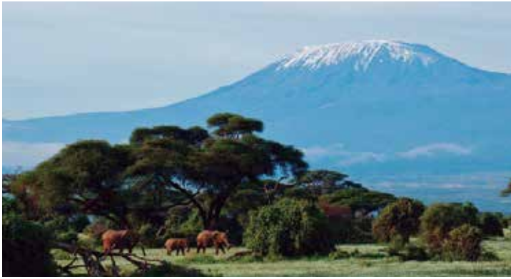
キリマンジャロを望む象の楽園・アンボセリ国立公園