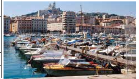
マルセイユの旧港