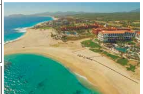
ヒルトン・ロスカボス・ビーチ&ゴルフリゾート