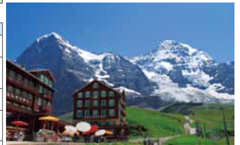
クライネシャイデック駅からアイガー北壁とメンヒの眺め