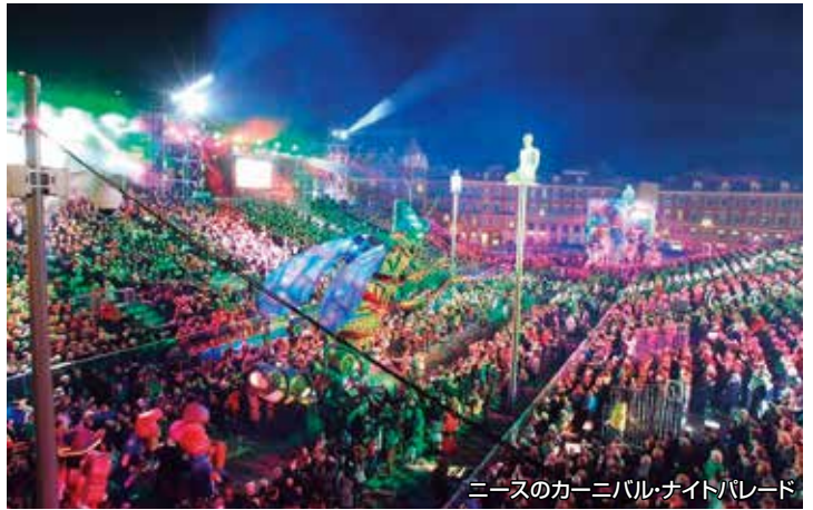
ニースのカーニバル・ナイトパレード