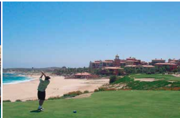
パハ・カリフォルニア半島南端のビーチ&ゴルフリゾート・ロスカボス(左)・パラミーヤゴルフクラブ(右)