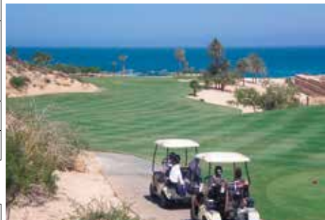
カボ・レアル・ゴルフクラブ