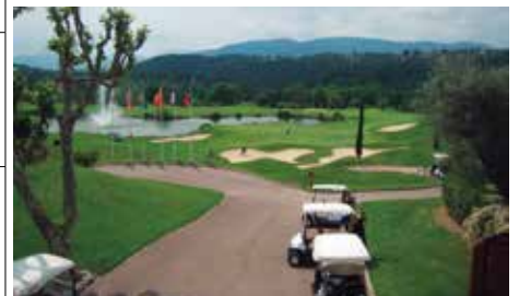
ロワイアル・ムージャンゴルフクラブ