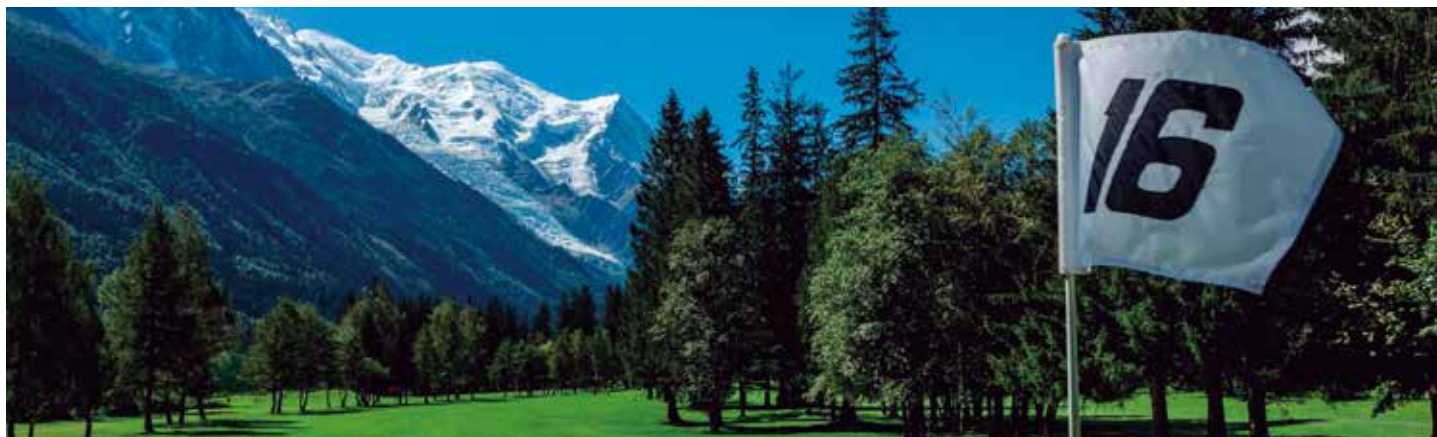
ゴルフクラブ・ド・シャモニー・16番グリーンからのモンブランの眺め