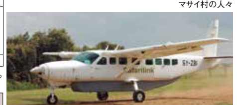
サファリ地区を結ぶセスナ機(20人乗り)