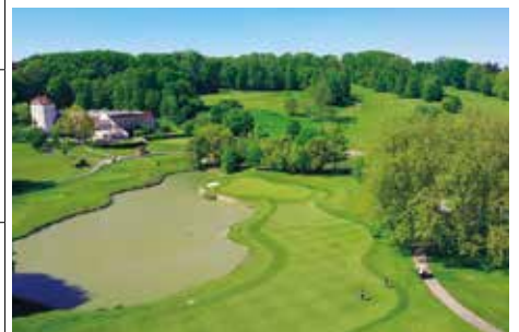
パリ・インターナショナルゴルフクラブ