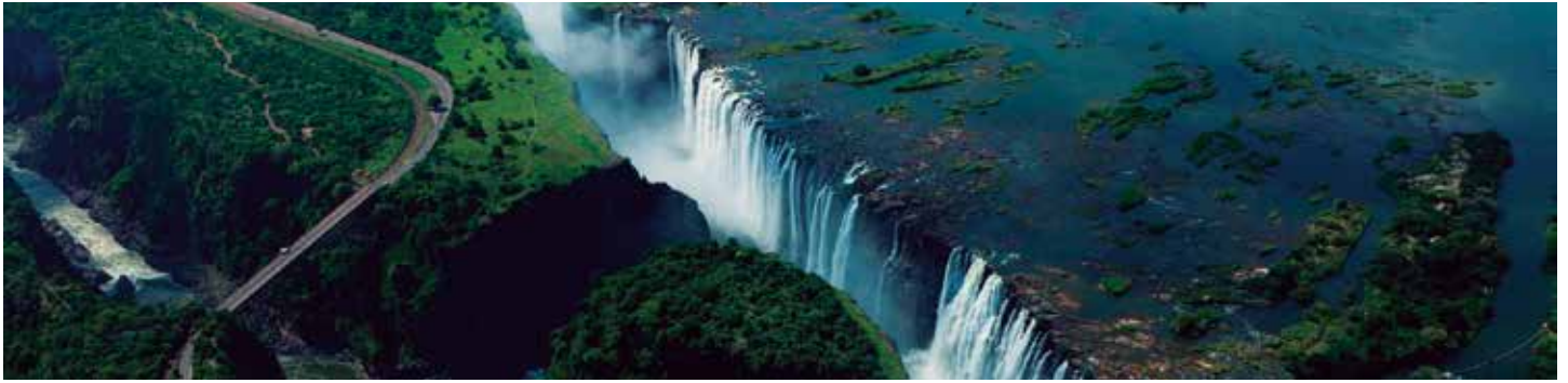
ビクトリアフォールズ

2018年10月14日(日)～10月25日(木)・添乗員同行・4ラウンドゴルフ付き